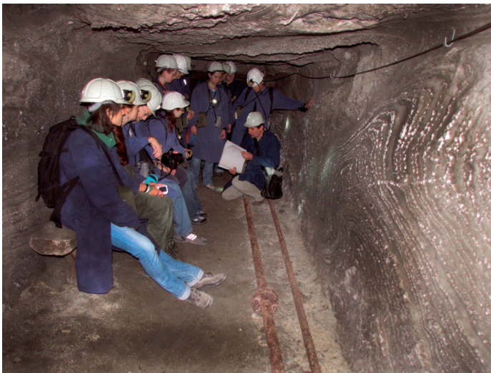
Fig. 2. Studenci AGH na zajęciach terenowych na trasie „Tajemnice wielickiej kopalni”

Zapoznanie się z problematyką geologiczną, górniczą i mierniczą w kopalni jest w ostatnich latach możliwe dzięki specjalistycznej trasie „Tajemnice wielickiej kopalni”, otwartej jesienią 2009 roku (Fig. 2, 3). Obejmuje ona wyrobiska poziomów I, IIa oraz III, ma długość około 3400 m. Wędrując tą trasą, można zapoznać się z odsłonięciami całego profilu geologicznego złoża, zjawiskami wtórnej krystalizacji halitu, sedymentacji ewaporatów oraz tektoniki solnej, a także metodami eksploatacji soli kamiennej w Wieliczce w XIX i XX wieku (d’Obyrn et al. 2010). Stanowiska dokumentacyjne i rezerwat Groty Kryształowe w dalszym ciągu odgrywają ważną rolę edukacyjną, między innymi obrazując proces monitoringu i prac zmierzających do zachowania pokrywy krystalicznej w Grotach. Zajęcia prowadzone były i są także w innych częściach kopalni, na przykład na niższych poziomach (VI–VII) w rejonach najważniejszych wycieków kopalni.