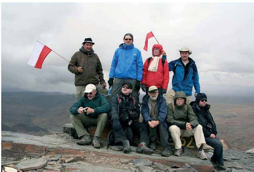
Fig. 5. Na szczycie Chacaltaya 5431 m n.p.m., Boliwia

Fig. 4. Polish pennants over Machu Picchu, Peru