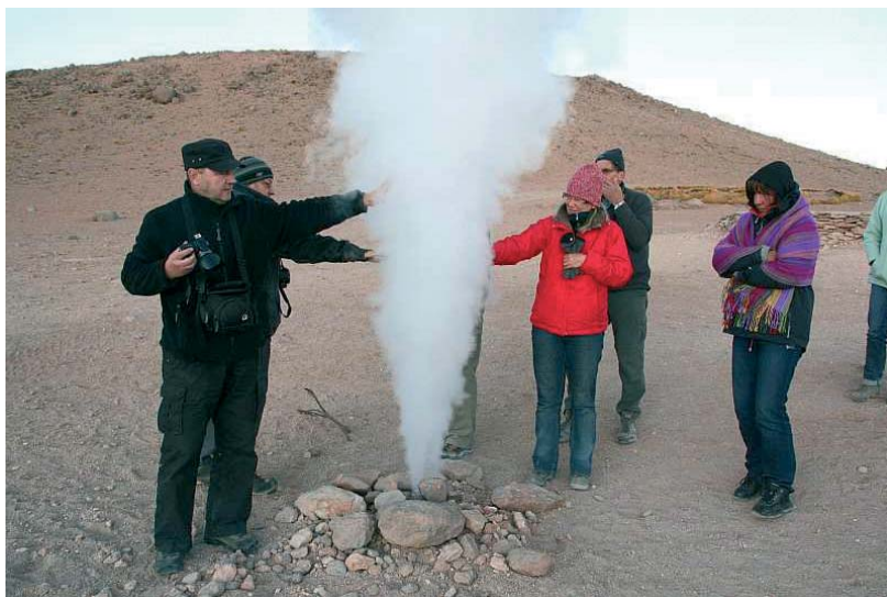
Fig. 10. Przy „gejzerze” Sol de Mañana, Boliwia