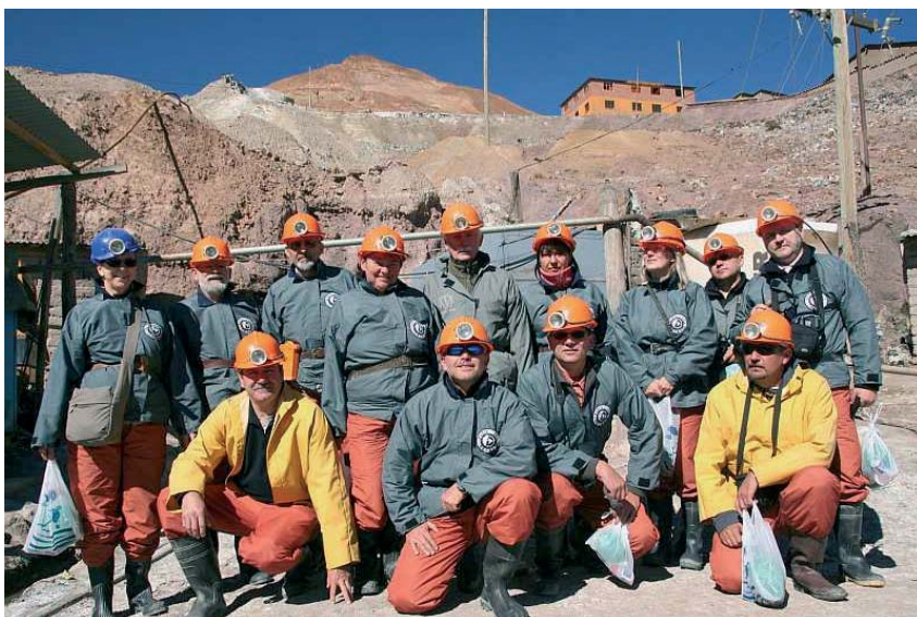
Fig. 6. Udajemy się na zwiedzanie kopalni srebra w Potosi, Boliwia. W rękach trzymamy „dary dla górników”

Uczestnicy wyprawy zwiedzili jeden z poziomów czynnej kopalni, która liczy ich siedem. Turyści zwyczajowo obdarowują górników prezentami, na które składają się liście koki, paczka papierosów, alkohol oraz laski dynamitu (Fig. 6). Pokazano nam też ceremonie górnicze, mające zapewnić przychylność diabła władającego podziemiemi.