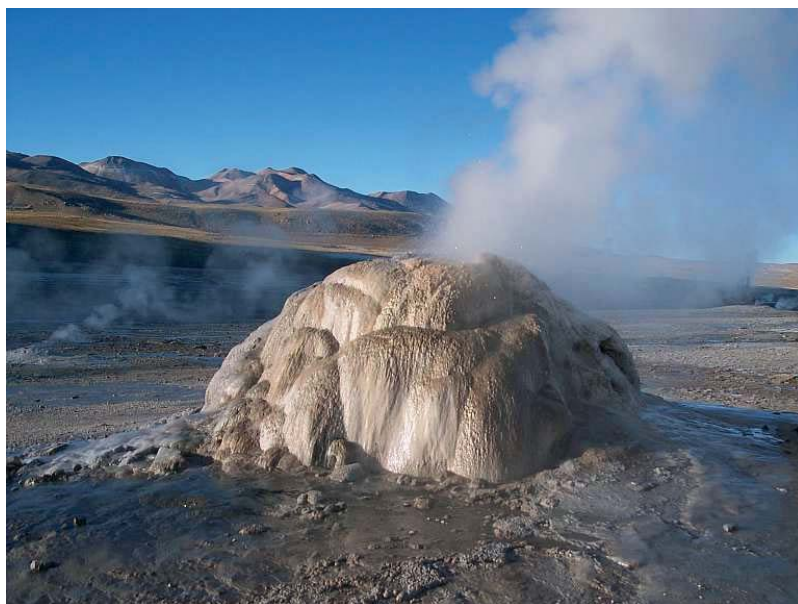
Fig. 11. Pole gejzerowe El Tatio, Chile. Wokół minigejzerów tworzą się stożki martwicy wapiennej