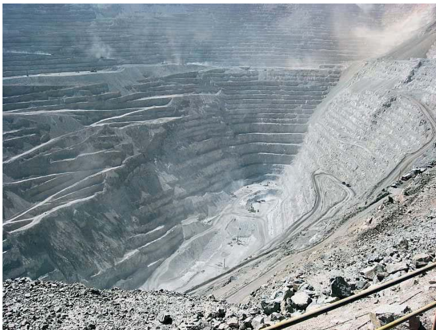
Fig. 13. Kopalnia Chuquicamata, Chile – odkrywka głębokości 850 m