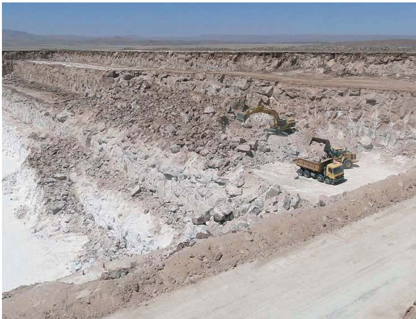
Fig. 14. Kopalnia SPL, Chile – eksploatacja soli w odkrywce „Kainit”