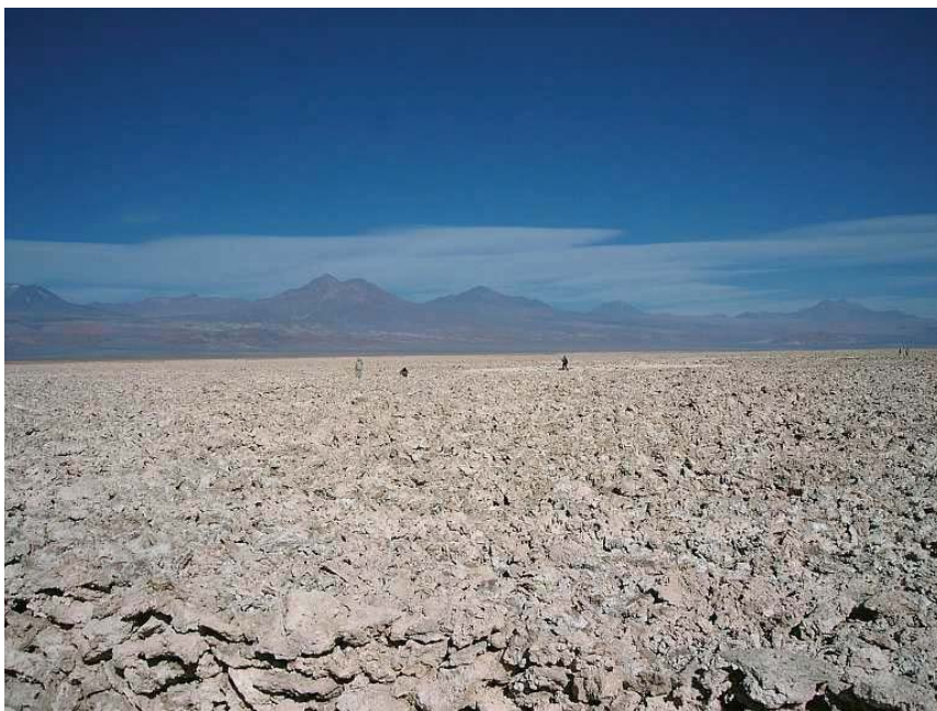
Fig. 12. Salar de Atacama, Chile – widać jego powierzchnię, przypominającą świeżo zaoraną ziemię

Powierzchnia salaru wynosi niecałe 2400 km 2 , orientacyjne rozmiary 100 km × 80 km. Leży on pomiędzy głównym łańcuchem Andów a Kordylierą Domeyki, średnio na wysokości ok. 2300 m n.p.m. Salar nie jest zalewany wodą, jednak przedostają się do niego wysoko zmineralizowane wody podziemne zasilające słone jeziora na jego obszarze, z których woda przesiąka na resztę terenu. Zależnie od rejonu na powierzchni salaru wytrąca się sól kamienna, sole magnezowo-potasowe lub boraks, podobnie jak w lagunach boliwijskiego Altiplano. Wytrącająca się sól miesza się z pyłem niesionym przez wiatr, w efekcie powierzchnię salaru pokrywają więc wykwity solno-pyłowe o wysokiej porowatości, z daleka wyglądające jak zorana ziemia, są one jednak twarde i ostre (Fig. 12).