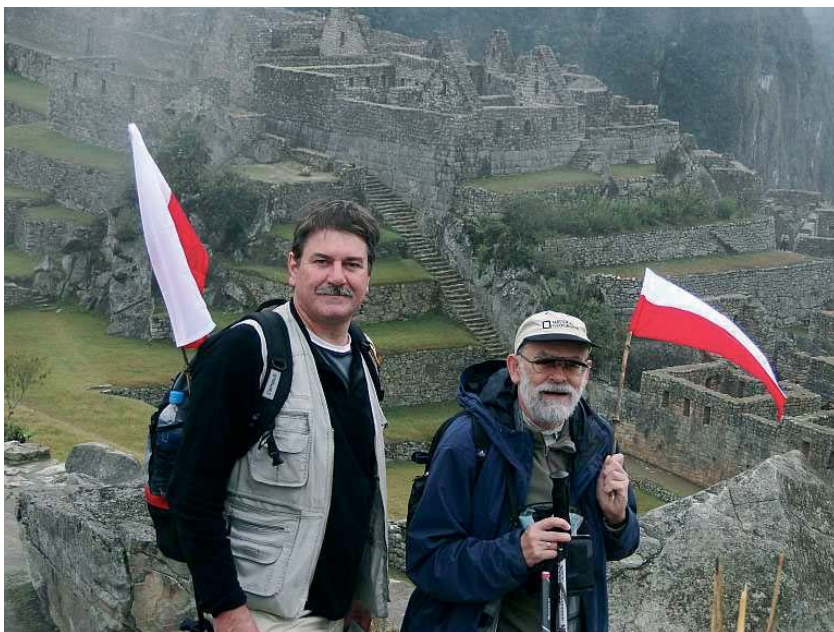
Fig. 4. Polskie proporce nad Machu Picchu, Peru

Fig. 4. Polish pennants over Machu Picchu, Peru