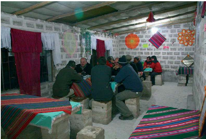
Fig. 9. W hotelu solnym przy Salarze Uyuni, Boliwia