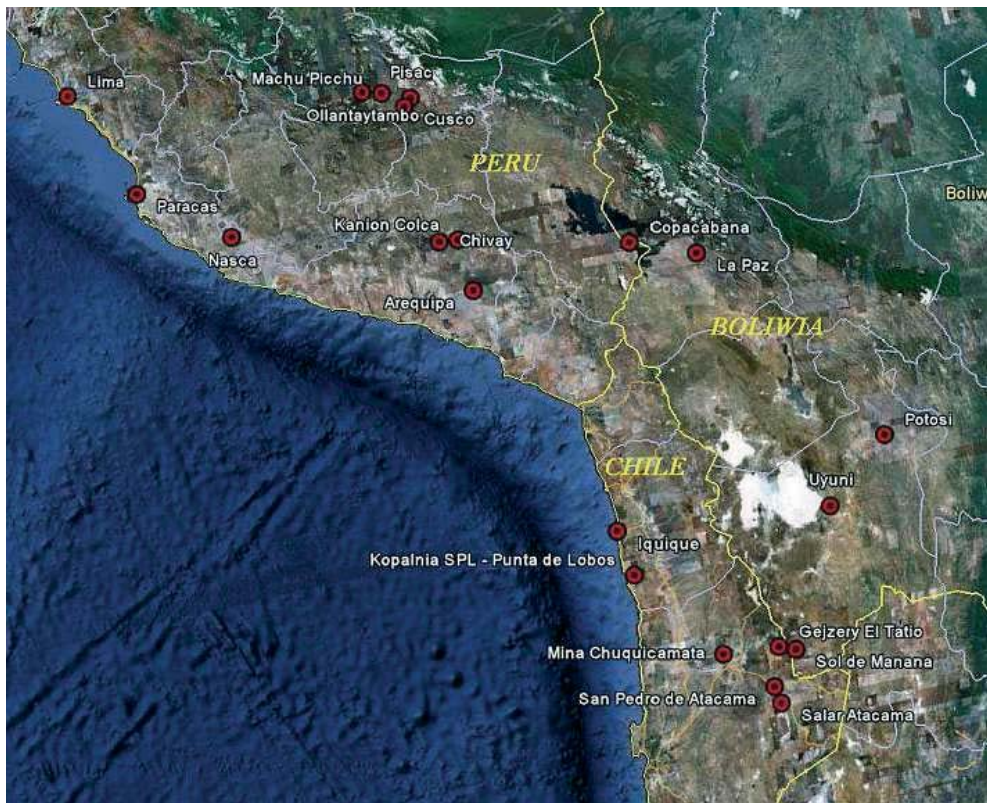
Fig. 1. Mapka – najważniejsze miejsca na trasie wyprawy PSGS (Mapy Google)