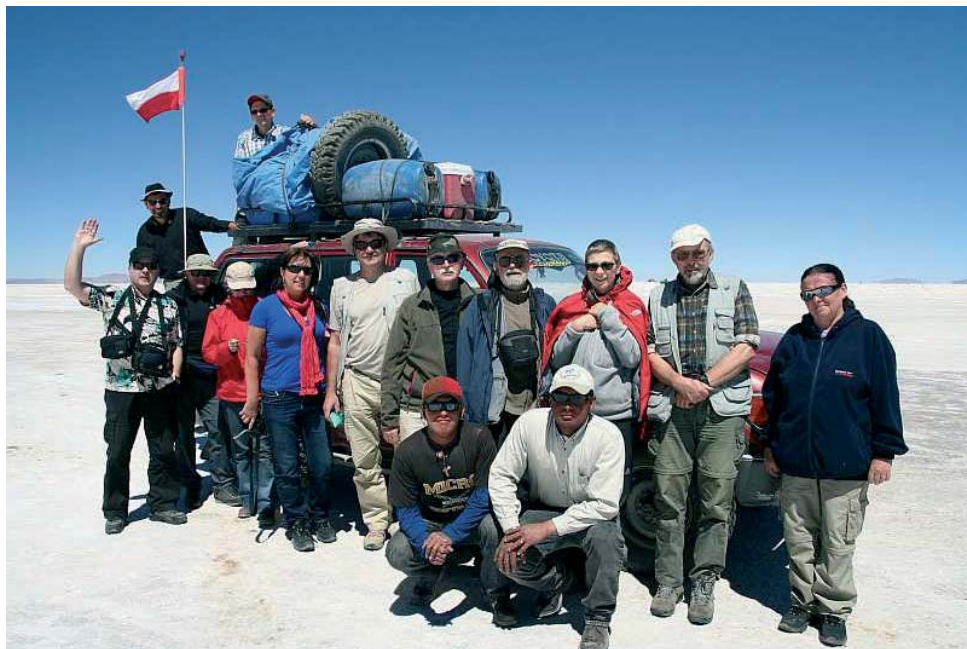
Fig. 7. Salar de Uyuni – wyprawa PSGS, przykucnęli nasi kierowcy

Słona woda zalewająca salar wyrównuje jego powierzchnię. Podaje się, że deniwela- cje mieszczą się w granicach 41 cm. Satelity korzystają z tego, by skalibrować swe wyso- kościomierze. Dzięki płaskiej powierzchni salar jest wykorzystywany przede wszystkim do celów komunikacyjnych, oczywiście w porze suchej (Fig. 7).