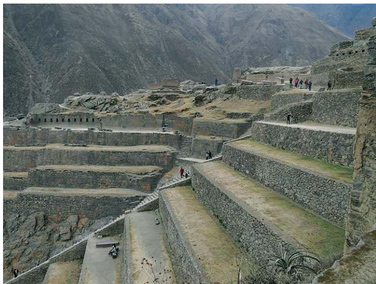
Fig. 3. Ollantaytambo, Peru – stoki górskie poniżej twierdzy zamienione przez Inków w tarasy uprawne