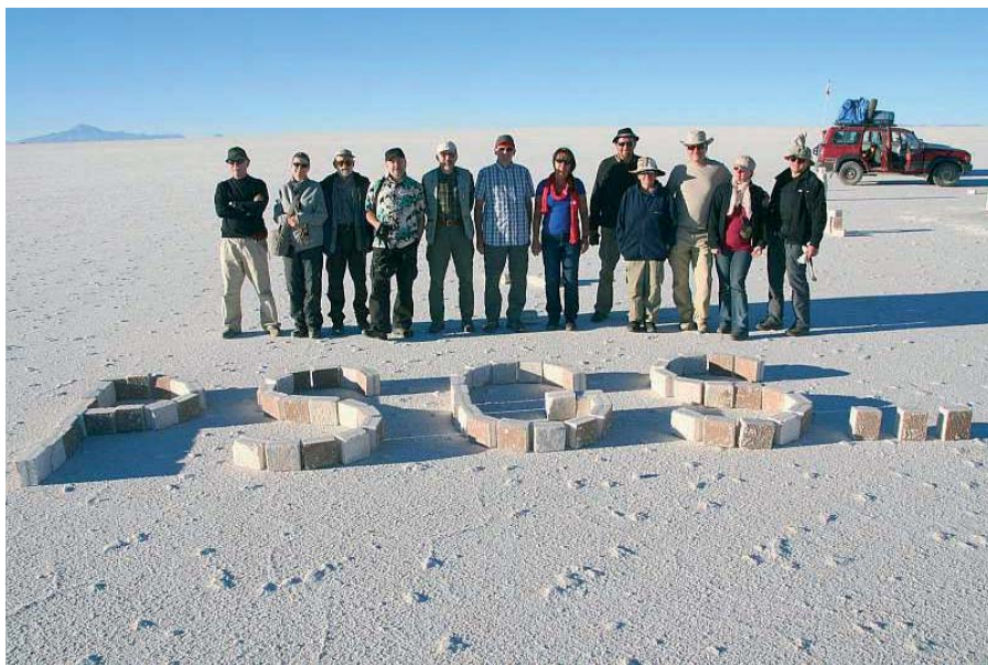
Fig. 8. Na Salarze Uyuni, Boliwia – widać jego idealnie płaską powierzchnię. Napis ułożony z solnych cegieł wycinanych z powierzchni salaru, używanych do budowy „solnych hoteli”

Lokalną osobliwością jest wycinanie z powierzchni salaru cegieł solnych (Fig. 8). Służą one do budowy budynków. W jednym z nich, w hotelu solnym w Chivica, wyprawa nocowała w bardzo egzotycznych warunkach. Cały budynek z wyjątkiem dachu wykonany był z solnych cegieł, także wyposażenie wnętrza – stoły, siedzenia, łóżka. Spąg był też wysypany solą (Fig. 9). Następną noc uczestnicy ekspedycji spędzili w schronisku koło Laguna Colorado – najwyżej położonym punkcie noclegowym wyprawy (ok. 4200 m n.p.m.). Był to zarazem kolejny nocleg w spartańskich warunkach: dwie „kozy” do ogrzania się podczas kolacji i prąd z generatora włączanego na dwie godziny, dwie toalety i jedna umywalka na cały obiekt. W nocy temperatura na zewnątrz spadała do -9^{\circ}\text{C} , a w pokojach do -1^{\circ}\text{C} .