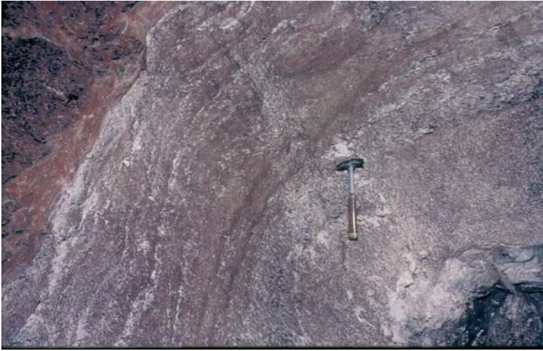
Fig. 5. Pogranicze piętra PZ3 i PZ4. Od lewej: strop zubru brunatnego (Na3t) z widocznymi spękaniami błotnymi, pokryty czerwoną solą kamienną z rozługowania stropowych partii zubru, sól podścielająca (Na4a0), anhydryt pegmatytowy (A4a1) (odsłonięcie w kopalni „Solno”, Inowrocław)

Fig. 5. The borderline between PZ3/PZ4 units. From left: the roof of Brown Zuber (Na3t) with visible mud cracks covered by red halite created by the dissolution of the top parts of zuber, Underlying Halite (Na4a0), Pegmatite Anhydrite (A4a1) (“Solno” mine, Inowrocław)