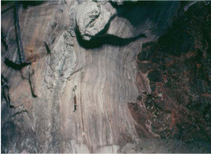
Fig. 3. Pogranicze pięter PZ3 i PZ4 na odsłonięciu w kopalni „Solno” w Inowrocławiu. Od prawej: strop zubru brunatnego (Na3t) z widocznymi spękaniami błotnymi, sól podścielająca (Na4a0), anhydryt pegmatytowy (A4a1), najmłodsza sól kamienna (Na4a1)

Fig. 3. The borderline between PZ3/PZ4 units exposed in the „Solno” mine, Inowrocław. From right: the roof of the Brown Zuber (Na3t) with visible mud cracks, Underlying Halite (Na4a0), Pegmatite Anhydrite (A4a1), Youngest Halite (Na4a1)