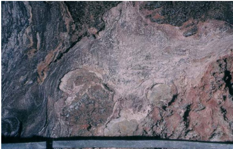
Fig. 7. Pogranicze piętra PZ3 i PZ4. Strzęp zmiążdżonej i porozrywanej tektonicznie soli podścielającej zawierającej obtoczone fragmenty iłowca ze stropu zubru brunatnego, kontaktujący się z anhydrytem pegmatytowym (od lewej), i z zubrem brunatnym (od prawej) (odsłonięcie w kopalni „Solno”, Inowrocław)