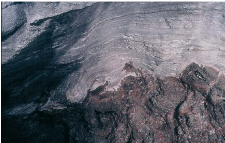
Fig. 4. Kontakt stropowej powierzchni zubru brunatnego z solą podścielającą: widoczne spękania błotne i warstewka anhydrytu bezpośrednio na stopie zubru (odsłonięcie w kopalni „Solno”, Inowrocław)

Fig. 3. The borderline between PZ3/PZ4 units exposed in the „Solno” mine, Inowrocław. From right: the roof of the Brown Zuber (Na3t) with visible mud cracks, Underlying Halite (Na4a0), Pegmatite Anhydrite (A4a1), Youngest Halite (Na4a1)