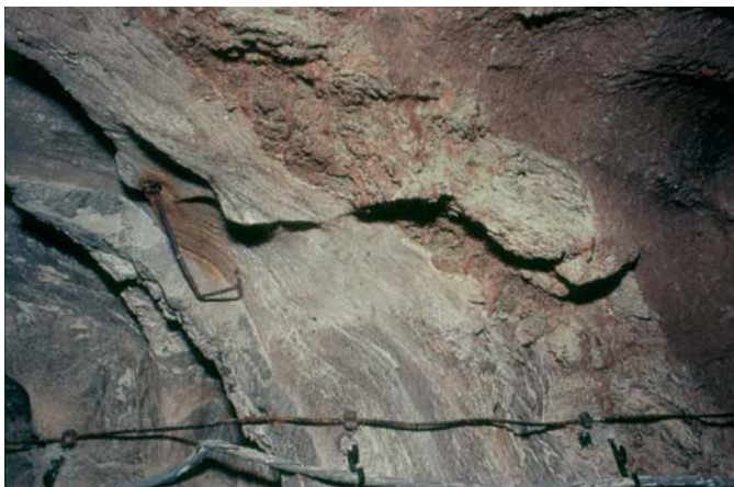
Fig. 6. Pogranicze pięter PZ3 i PZ4. Od prawej: strop zubru brunatnego (Na3t) ze strefą ilowca, który powstał z zubru w wyniku wyługowania soli, z widocznymi spękaniami błotnymi, sól podścielająca (Na4a0), anhydryt pegmatytowy (A4a1), najmłodsza sól kamienna (Na4a1) (odsłonięcie w kopalni „Solno”, Inowrocław)

Fig. 5. The borderline between PZ3/PZ4 units. From left: the roof of Brown Zuber (Na3t) with visible mud cracks covered by red halite created by the dissolution of the top parts of zuber, Underlying Halite (Na4a0), Pegmatite Anhydrite (A4a1) (“Solno” mine, Inowrocław)